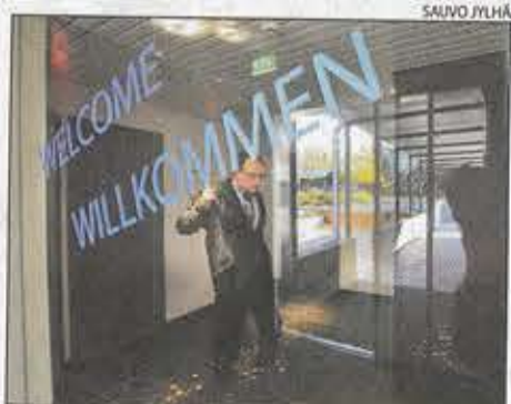
Onnela on valmis ottamaan vastaan vieraan mistä vain maailmalta. – Meidän tehtävämme on kertoa missä me olemme ja miten tänne pääsee.

– Siitä on vahva näyttö Ateneumissa tällä hetkellä avoinna oleva näyttely Järven luno, jossa Tuusulanjärven taiteilijayhteisöstä on ansioikas näyttely. Näiden taiteilijoiden työt